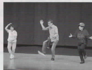
消費者啓発コント劇団公演の様子